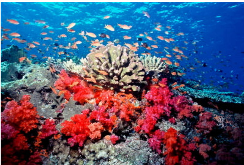
105316: Fidzin pehmytkorallien ylenpalttisen runsauden salaisuus ovat ravinnepitoiset merivirrat, jotka koralleja. Korallipuutarhat puolestaan tarjoavat suojapaikan ja ravintoa tuhansille kalalajeille ja meren selkärangattomille.