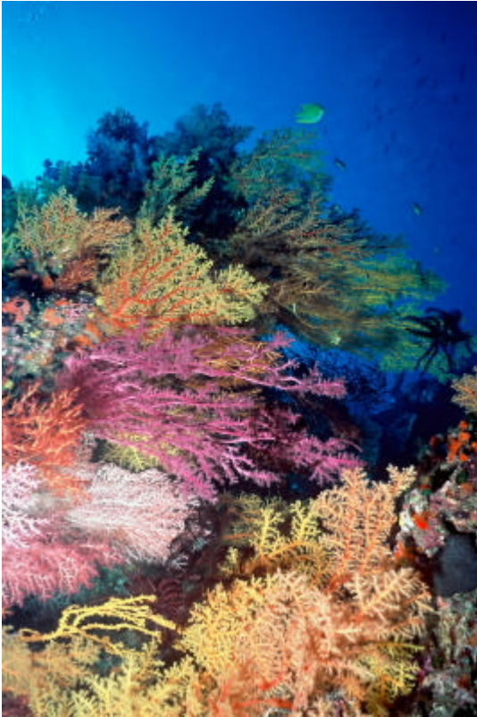
105317: Chironephthya-pehmytkoralleja. Fidzin pehmytkorallit ovat maailmankuuluja värikyydestään ja lajirunsaudestaan.