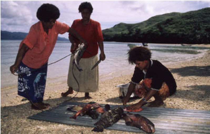
57824: Ono-saarella sijaitsevan Waisomon kylän naiset puhdistavat kalansaalista ja valmistelevat koko kylälle juhla-ateriaa kylään saapuneiden vieraiden kunniaksi.