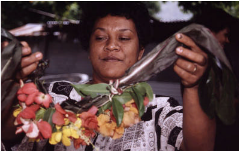
57816: Waisomon kylässä Ono-saarella vieraat toivotetaan tervetulleiksi ripustamalla heidän kaulaansa kukista solmittu seppeli eli paikallisella kielellä salu salu .