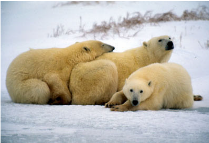
48469: Jääkarhuemo poikastensa kanssa kuvattuna Churchillissa Kanadassa.