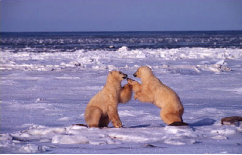
36212: Kaksi jääkarhua nahistelee Churchillissa Kanadassa.