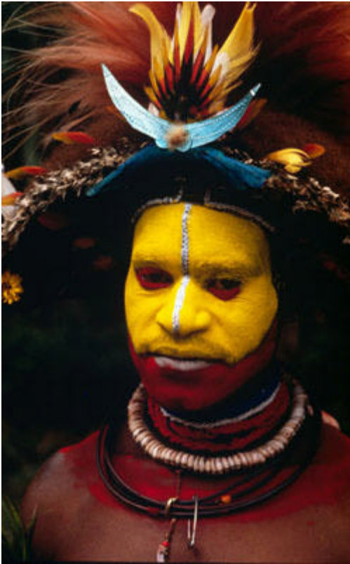
32432: Huli-heimoon kuuluva mies Papua-Uusi-Guineassa.