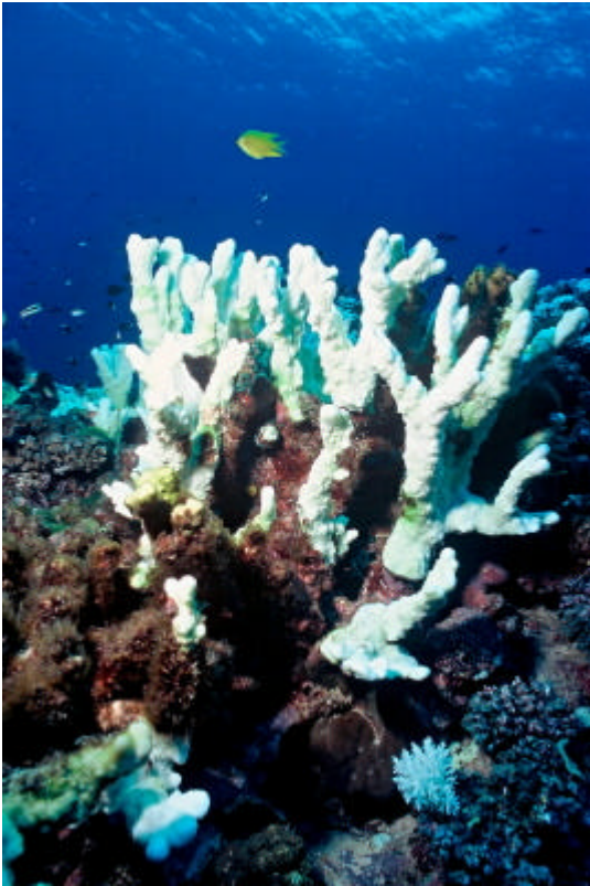
105312: Haalistuneita koralleja. Meriveden lämpötilan pienikin nousu on kohtalokas symbionttisille leville, jotka antavat koralleille niiden värin ja niiden tarvitsemat ravinteet. Pahimmissa tapauksissa haalistuminen johtaa korallien kuolemaan.