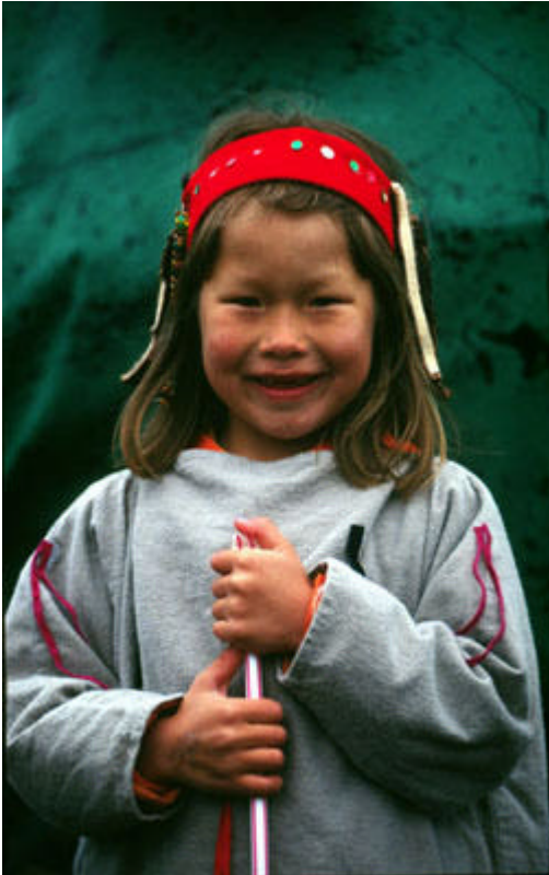
58367: Nuori aleuttityttö St Paulin saarella Alaskassa.