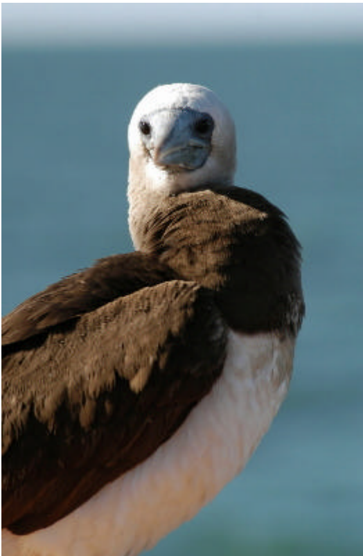
107853: Ruskosuula ( Sula leucogaster ) on yksi niistä lintulajeista, joiden rannalla sijaitsevia pesiä on tuhoutunut myrskyjen aiheuttamien nousuvesien yleistyttyä ilmastonmuutoksen myötä.